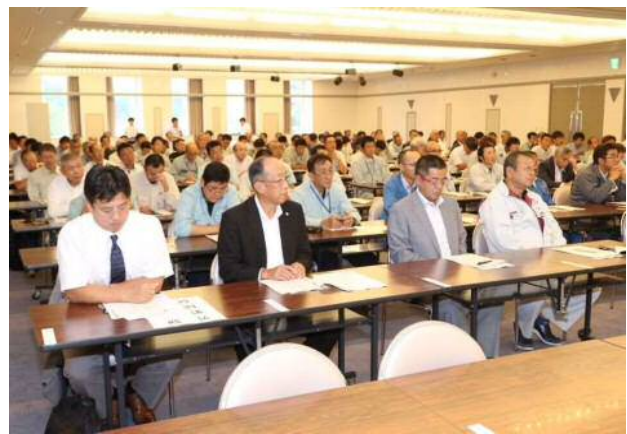
会場状況(会員席側)