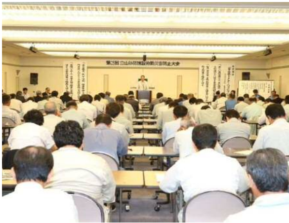
会場状況(ひな壇側)