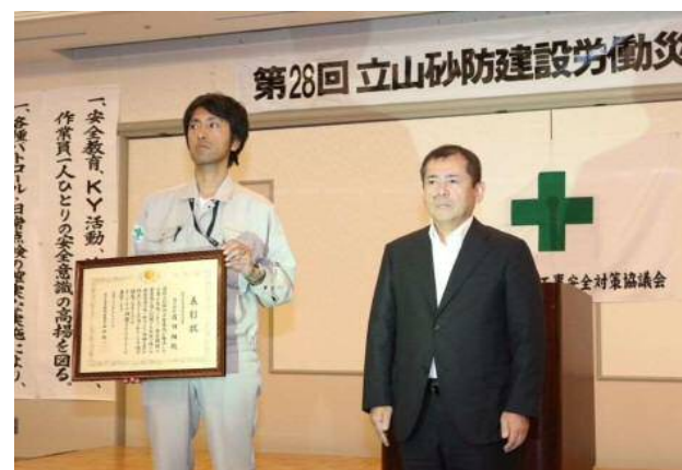
安全管理優良受注者(受賞報告)