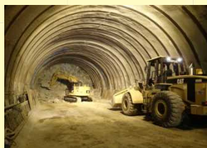
●トンネル掘削作業中です。