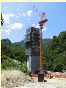
●P2橋脚を施工しています。