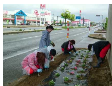
日本道路協会長表彰 【(株)丸山自動車】