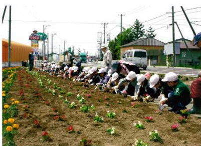
国土交通大臣表彰 【加治コミュニティ協議会】