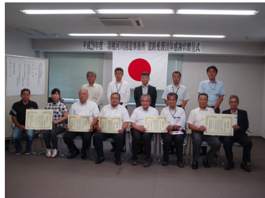
【昨年度の感謝状贈呈式】