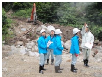
砂防現場見学イメージ

移動について： ・黒部溪谷鉄道に乗車される場合は、 料金が必要 となります。 ・黒部溪谷鉄道「黒薙駅」下車後、 線路上・砂利道を約40分徒歩 で移動します。 ・線路上を単独で移動される場合は、 別途黒部溪谷鉄道への申請が必要 になります。