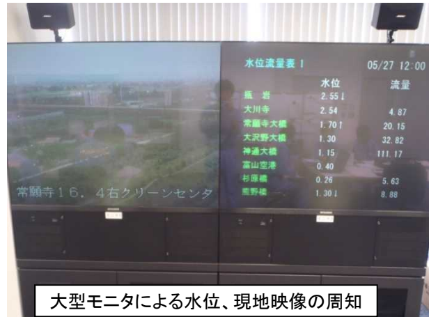
大型モニタによる水位、現地映像の周知