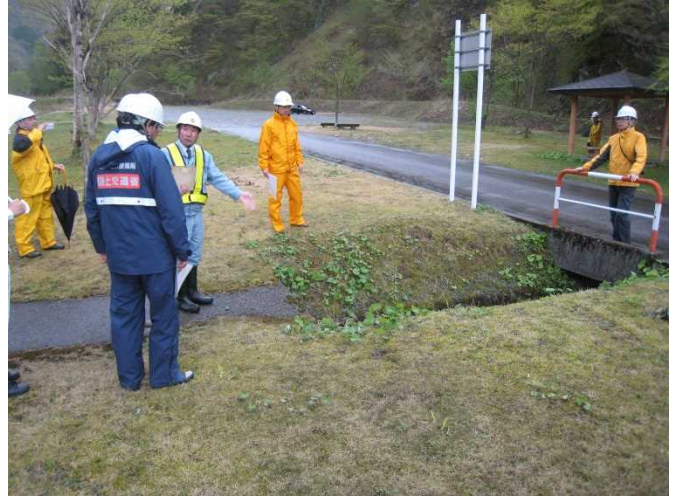
安全利用点検を行う参加者 (立山1号公園)