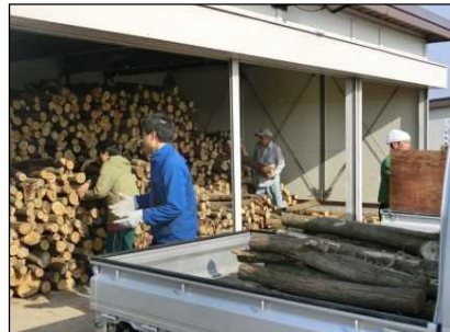
昨年3月の配布状況 水防倉庫前での配布となります。