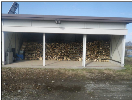
提供する樹木の集積状況