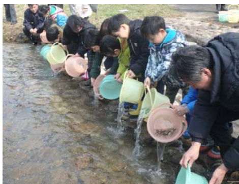
サケ放流の様子（平成29年3月）

場所： 村上市葛籠山地先 神林水辺の楽校（がっこう） 荒川右岸 国道7号「荒川橋」上流約1 km