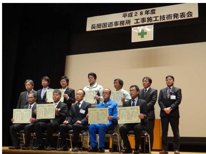
【昨年度の開催状況】