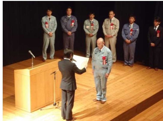
▲昨年度の表彰式の状況