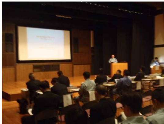
▲昨年度の論文発表状況