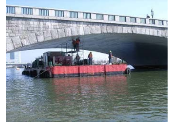
台船による橋梁定期点検

萬代橋の橋梁定期点検は、5年に1回のサイクルで、橋梁全体を近接目視で損傷状況を点検します。