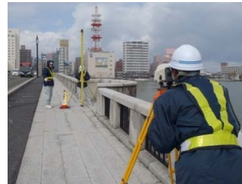
歩道上の測量作業

定期測量は、2年に1回、歩道上に設置した観測鋺の間隔(アーチ部)・高さ、川底を測量し、変状を確認します。