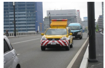
道路パトロール車による巡回

道路巡回は、萬代橋上を道路パトロール車により、目視にて、車道及び歩道部の路面や高欄等の道路及び道路利用状況等を確認します。