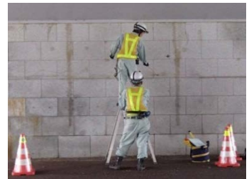
萬代橋が交差している市道上の点検

定期点検時及び定期点検から2~3年後に1回、走行車両及び歩行者の安全・安心を目的に、萬代橋の下を交差している市道上の橋桁等に損傷がないか確認します。