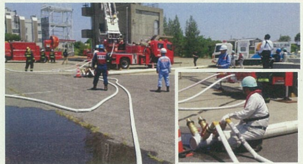
給水・放水の連携作業状況