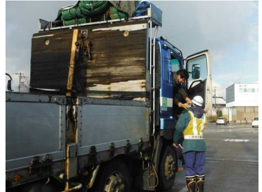
H28.12.15 啓発チラシ配布状況 (道の駅「万葉の里高岡」)