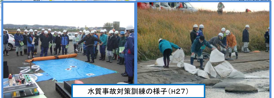
水質事故対策訓練の様子(H27)