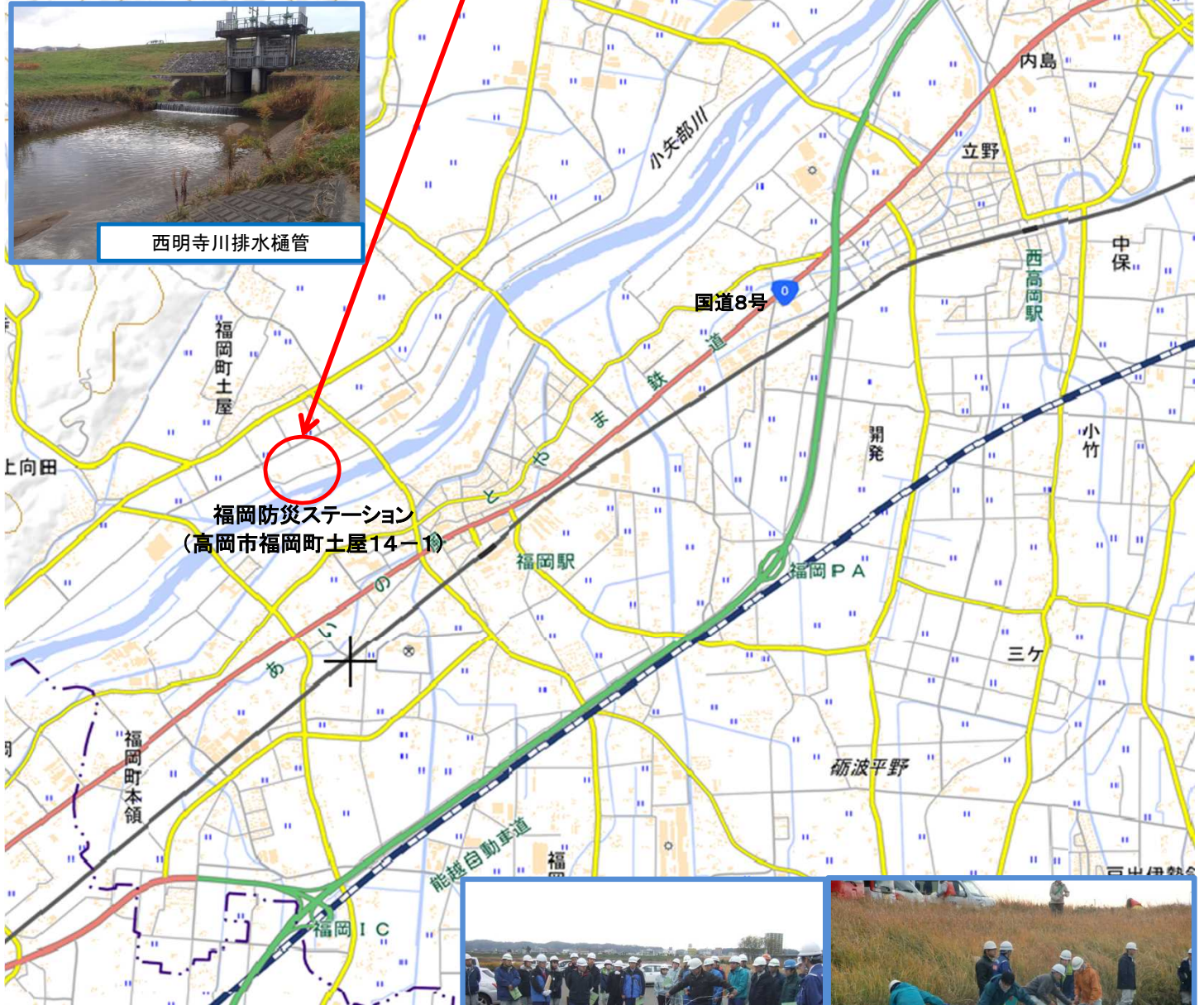
福岡防災ステーション (高岡市福岡町土屋14-1)