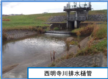
西明寺川排水樋管