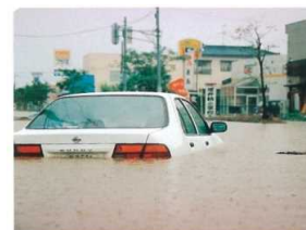
大堰幹線は1mも冠水