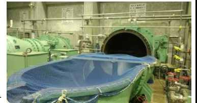
昨年度の分解整備 (3号ポンプ)の様子