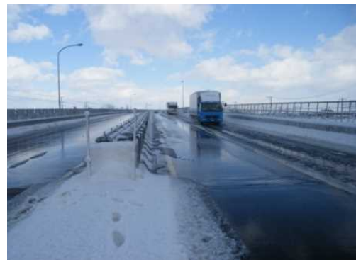
消雪パイプの設置イメージ （国道17号十日町高架橋）

※1:「平成28年1月集中豪雪の検証・対策検討会」の資料は下記アドレスより入手できます。