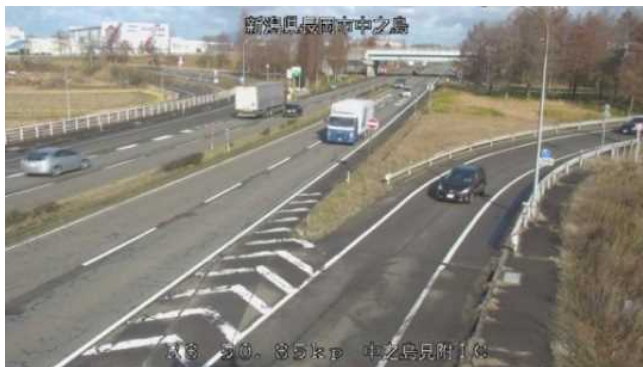
（静止画像）国道8号中之島見附IC