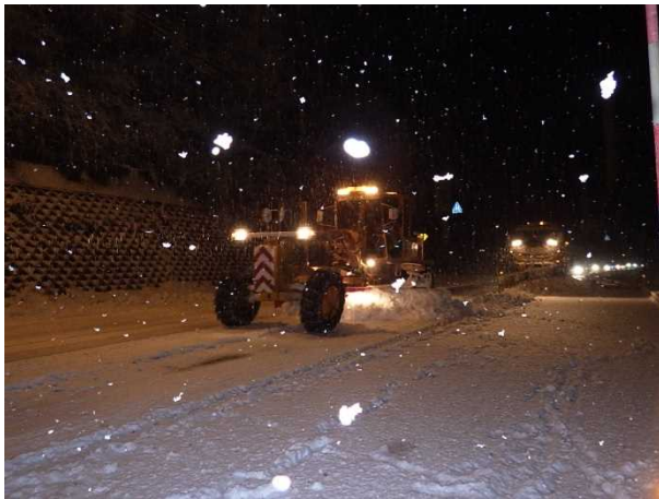
除雪グレーダ(阿賀町 ふくとり 福取地先)