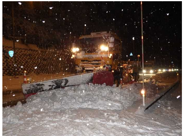
除雪トラック(阿賀町 ふくとり 福取地先)