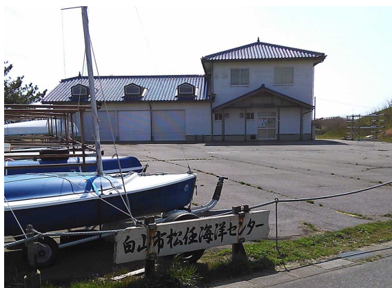
交付式会場（松任市海洋センター）