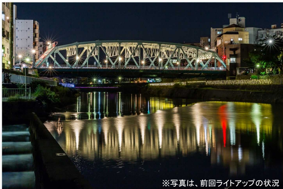
※写真は、前回ライトアップの状況