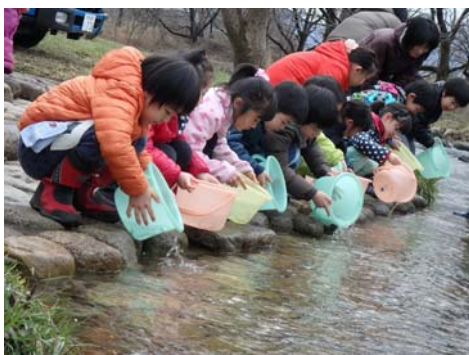
サケ放流の様子（平成28年3月）

場所： 村上市葛籠山地先 神林水辺の楽校（がっこう） 荒川右岸 国道7号「荒川橋」上流約1 km