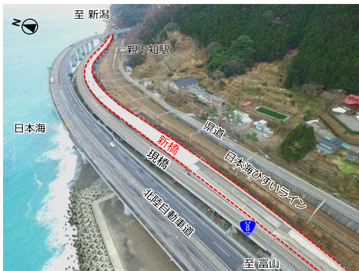
歌高架橋周辺状況(平成29年2月撮影)