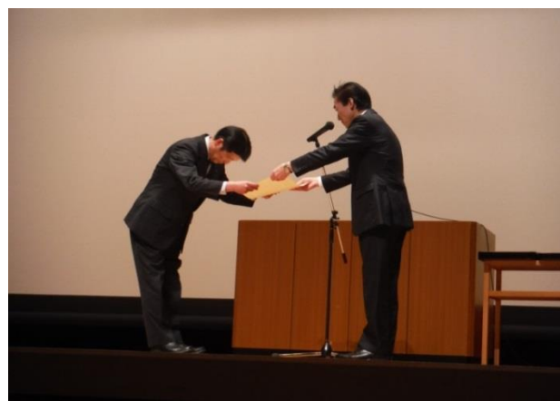
【昨年度の開催状況】