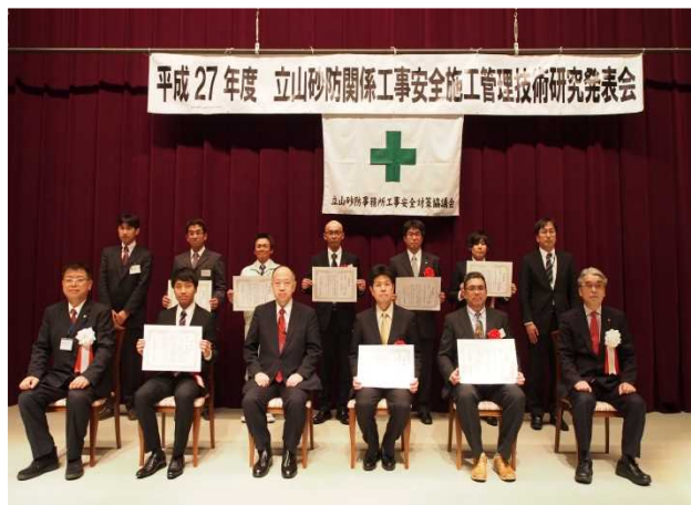
受賞者との記念撮影