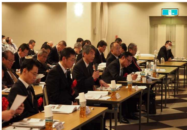
発表会の様子(219名の参加)