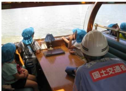
水上バスから堤防整備の様子を見学