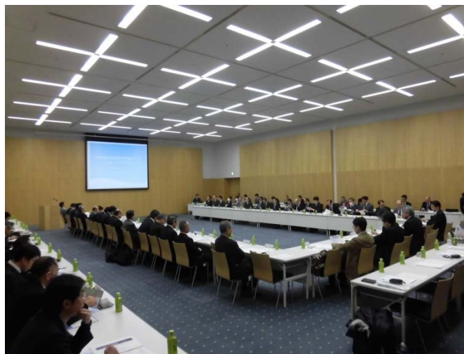
平成27年度の北陸地域国際物流戦略チーム 幹事会の状況

お車：北陸自動車道(関越道直結)「新潟西IC」から新潟バイパス経由「紫竹山IC」利用で約20分(新潟港方面)