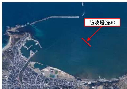
輪島港 輪島崎地区 避難港整備(石川県)