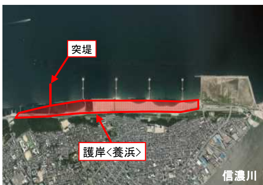
新潟港海岸西海岸地区 海岸保全施設整備(新潟県)