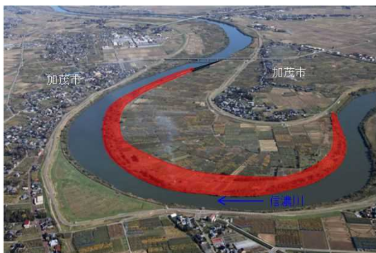
信濃川下流 山島新田地区 河道掘削(新潟県)