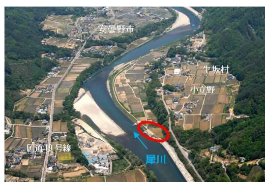
千曲川 小立野地区 堤防整備(長野県)