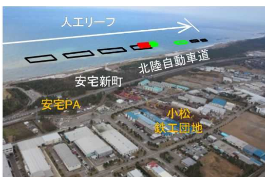
石川海岸 小松工区 海岸保全施設の整備(石川県)