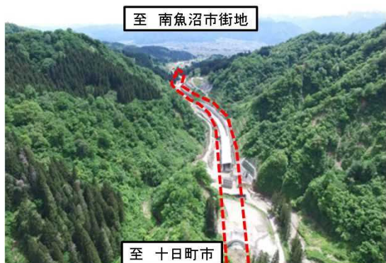
国道253号八箇峠道路 改良工事(新潟県)