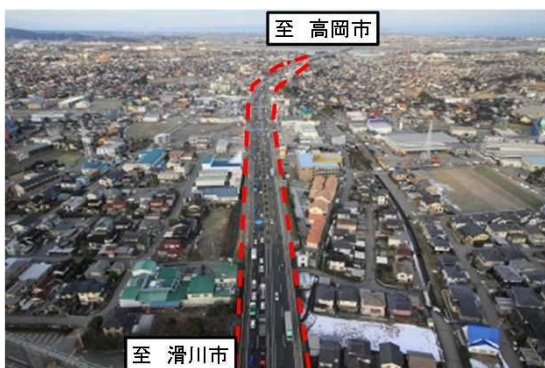
国道8号豊田新屋立体 改良工事(富山県)