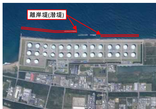
福井港海岸福井地区 海岸保全施設整備(福井県)