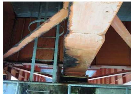
道路の老朽化対策