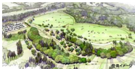
国営越後丘陵公園(新潟県)