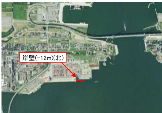
伏木富山港 新湊地区 岸壁整備(富山県)