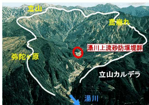
常願寺川水系砂防 湯川上流砂防堰堤群の整備(富山県)