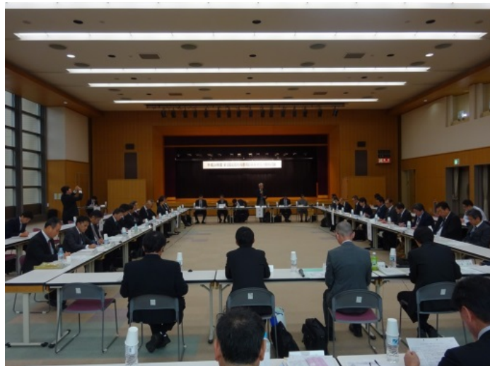
平成28年度 第1回 北陸地域港湾の事業継続計画検討会の状況