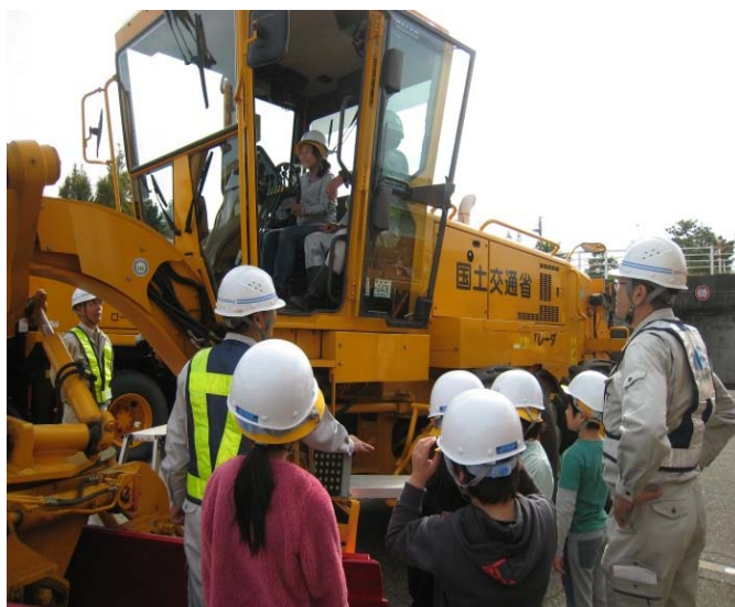
▲体験学習会の様子