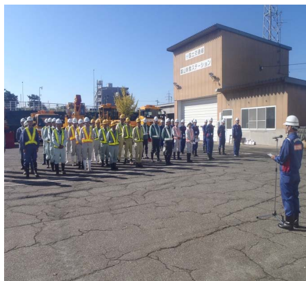
▲除雪出動式の様子