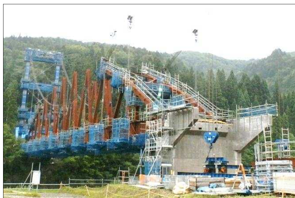
右岸から左岸方向を望む（7月23日撮影）