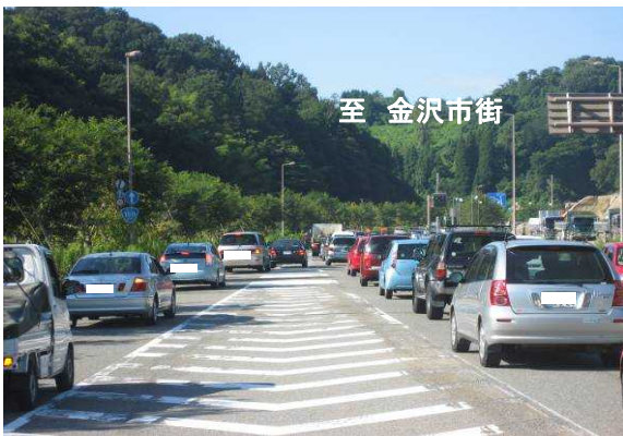
【東長江の混雑状況】 (富山方面から金沢市街方面を望む)