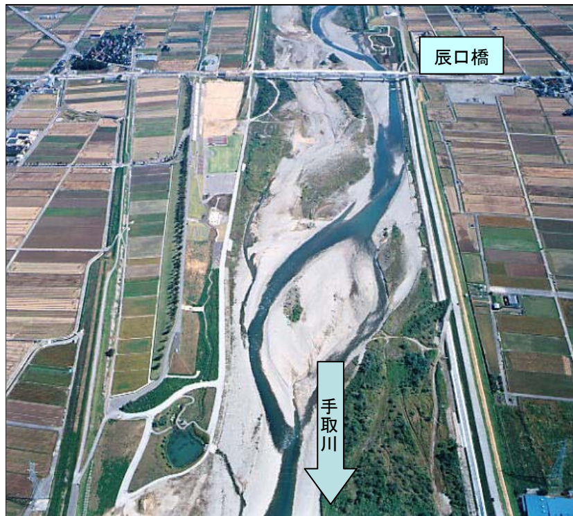
手取川(7.0km) 川北町辰口橋付近

○手取川の「霞堤」は、扇状地上に築かれた前近代の治水技術を伝える貴重な土木遺産であり、現在もその機能有するとともに、見事な不連続堤を遺していることから、今回、土木学会の「選奨土木遺産」に選定されました。