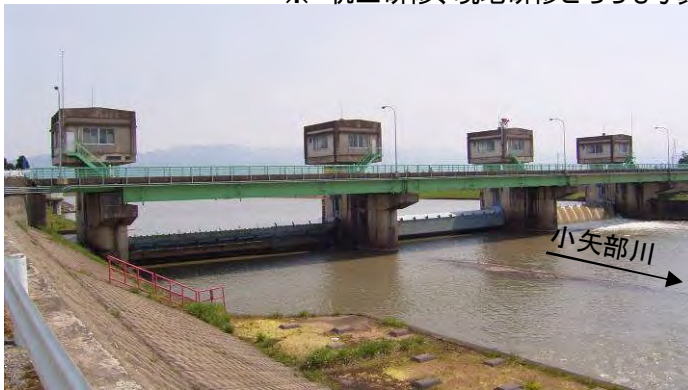
小矢部大堰全景(右岸下流側より、上流側を望む)