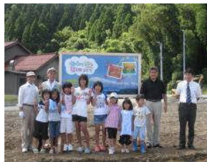
参加した子どもたち