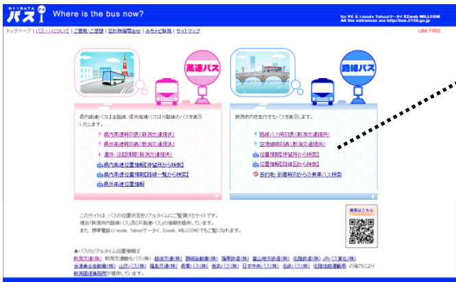
バス位置情報提供の例（パソコン）