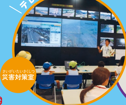
さいがいたいさくしつ 災害対策室