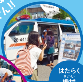
はたらく まい 機械 コーナー