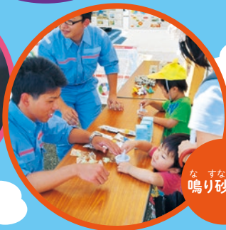
な すなたいけん 鳴り砂体験