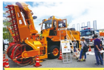
はたらく機械コーナー