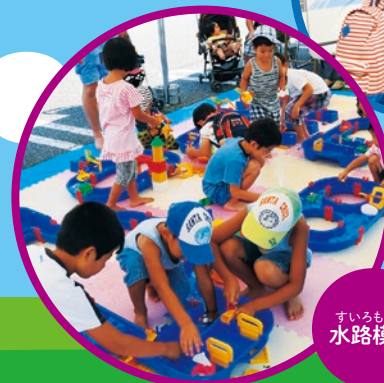
すいろもけい 水路模型