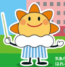
気象庁マスコットキャラクター はれるん