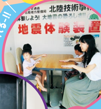
じしんたいけん 地震体験