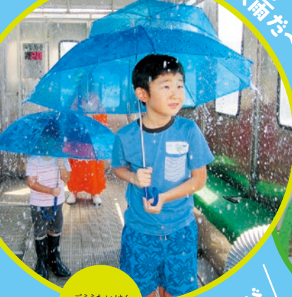
ごうたいけん 豪雨体験