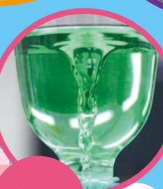
うずま じつけん 渦巻き実験