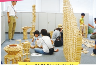
積み木建物等作り体験