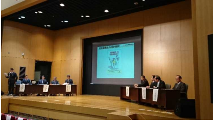
▲ 地元企業による自社での取組事例の紹介