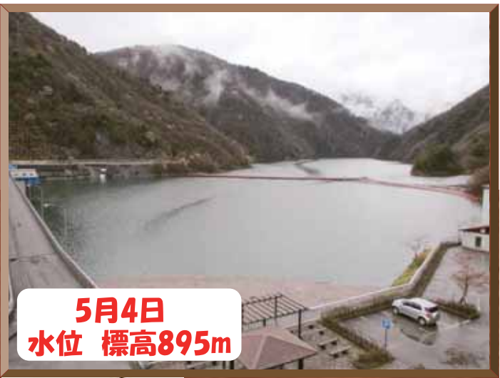
5月4日 水位 標高895m