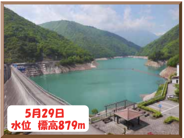
5月29日 水位 標高879m