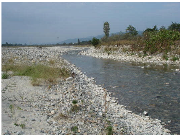
水量が減っている高瀬川

冬になると高瀬川の水量が減少します。大町ダムでは 1 月 10 日から 3 月 31 日までの間、上流からの流入量に毎秒 3m^3 の水を上乘せして高瀬川へ放流しています。約 3 ヶ月間で、ダム貯水位を約 28m 下げ、約 2,000 万 m^3 (東京ドーム約 16 個分) を放流し、青木湖の水位低下と高瀬川の水量の減少を最小限に防いでいます。