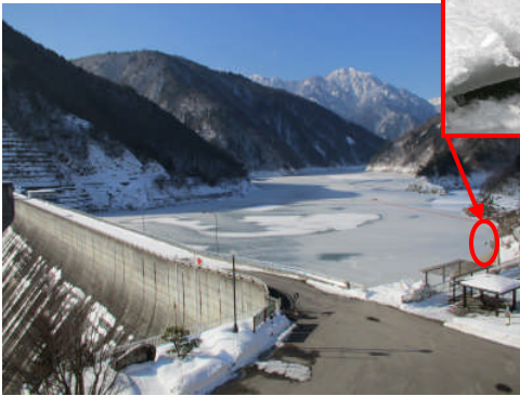
氷が張った龍神湖！氷の厚さはなんと約 15cm！(2月 22 日撮影)