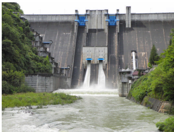
9 月 22 日の大町ダム放流状況

平成 23 年度は、短期間に集中的に多くの雨が降りました。特に、9 月 21 日には前線と台風 15 号による雨が降り、大町ダムは約 177 万 m^3 (東京ドーム約 1.5 個分) の水をダム湖へ貯めました。これにより、高瀬下橋水位観測所 (高瀬川) の水位を低下させることができました。