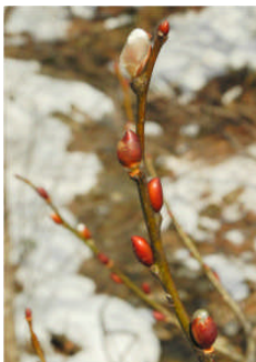
ネコヤナギの仲間？

つぼみがふくらみ、春が近づいているのを感じます。 小さい春見～つけた (o^ ^o) (2月 24 日撮影)