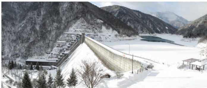
雪の積もったダム(2月 10 日撮影：パノラマ)

月別の最大積雪深は 12 月 38cm、1 月 66cm、2 月 68cm となっており、12 月と 2 月は例年並み、1 月は例年より 8cm 程多くなりました。