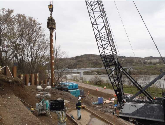
河道拡幅に伴う橋梁の架替工事