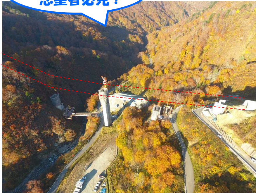
工事が進む 国道289号八十里越道路事業 (新潟県三条市~福島県只見町)