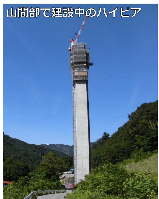
山間部で建設中のハイピア

国土交通省志望の皆様、国の大規模な現場等を見学し、 現場職員の生の声を聴ける絶好の機会です!