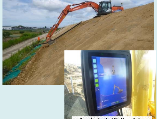
バックホウ操作パネル