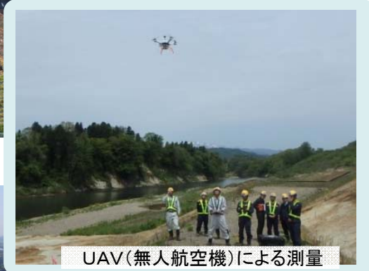
UAV(無人航空機)による測量