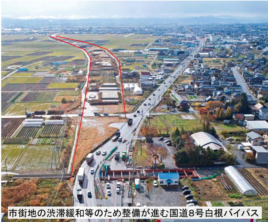
市街地の渋滞緩和等のため整備が進む国道8号白根バイパス