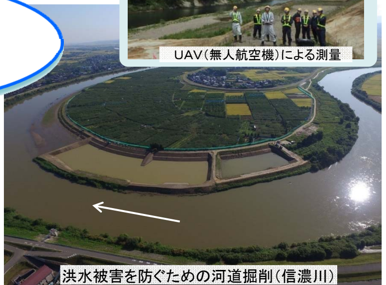
洪水被害を防ぐための河道掘削(信濃川)

国土交通省志望の皆様、国の大規模な現場等を見学し 現場職員の生の声を聴ける絶好の機会です！ 是非ご参加下さい！