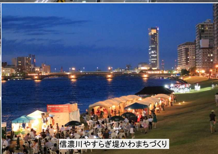
信濃川やすらぎ堤かわまちづくり

国土交通省志望の皆様、国の大規模事業を体験でき 現場職員の生の声を聴ける絶好の機会です！ 是非ご参加下さい！