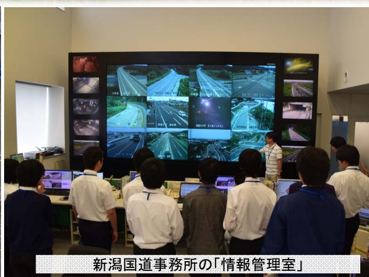
新潟国道事務所の「情報管理室」