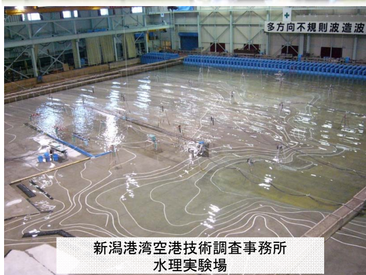
新潟港湾空港技術調査事務所 水理実験場