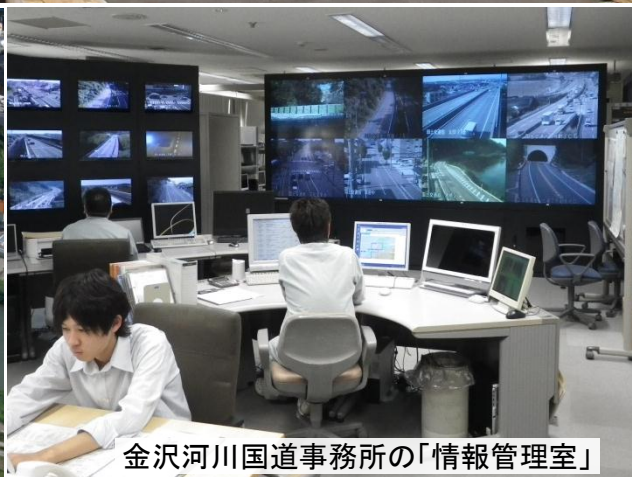
金沢河川国道事務所の「情報管理室」

あなたの“知りたい”に答えます！ 説明会だけでは体験できない、国の事業の最前線を 是非この機会に体験してください！！