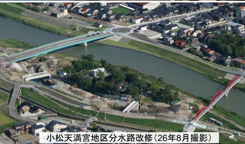
小松天満宮地区分水路改修(26年8月撮影)