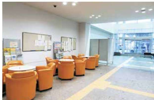
整備局の顔、庁舎エントランス。管理も大切な業務