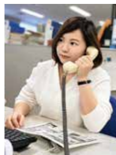
総務部 契約課 契約係