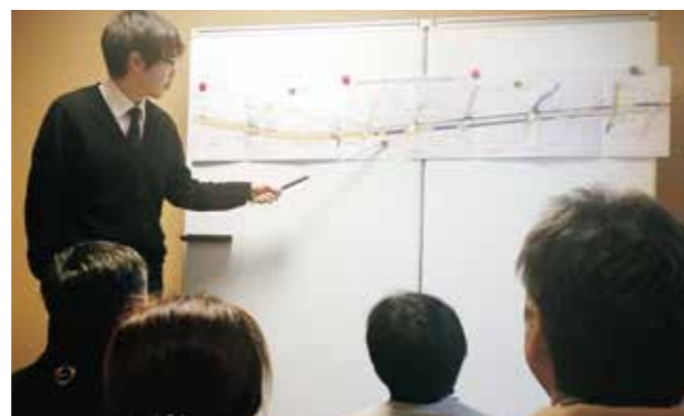
地権者への事業計画等の説明