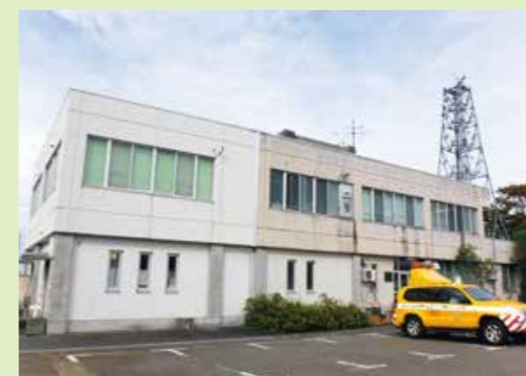
出張所(直江津国道維持出張所)

より地域に密着して社会資本整備や維持管理を行うため、73の出張所を各地域に配置しています。