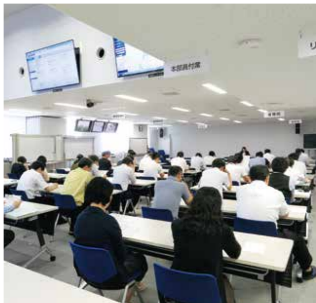
コンプライアンス講習会の開催

「総務・厚生」には、給与計算、福利厚生、庁舎管理など、北陸地方整備局で働く職員の処遇や職場環境に関する業務などがあります。 「会計・契約」には、工事を発注するための契約業務、備品等の購入をするための契約業務、国の建物などの財産を管理する業務、工事代金の支払いなど多額な予算執行に関する業務などがあります。