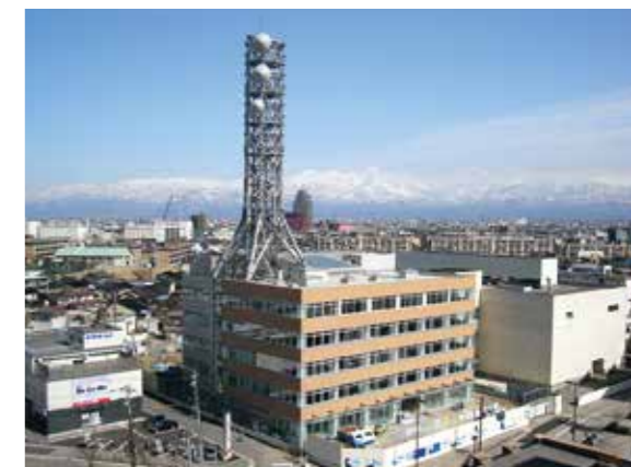
事務所(富山河川国道事務所)