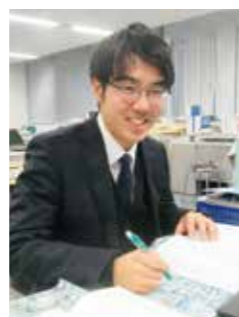
富山河川国道事務所 用地第二課 用地第二係