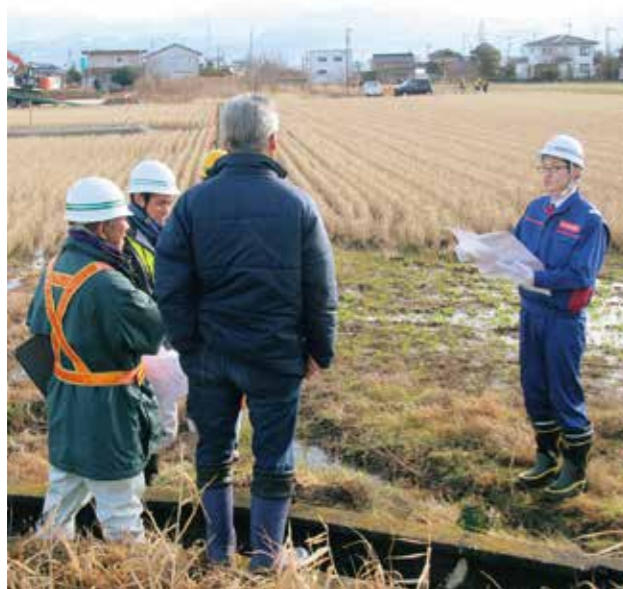
地権者との用地境界の確認立会

公共事業に必要となる土地の取得等とそれに伴う損失の補償を行うため、事業計画の説明、補償対象(土地や建物)の調査、補償金の算定、権利者との交渉、補償契約の締結、登記、補償金の支払い等、一連の手続きを行っています。補償金の算定に必要な基準は、公共事業を進める地方自治体に対しても、研修等を通じて説明・指導しています。