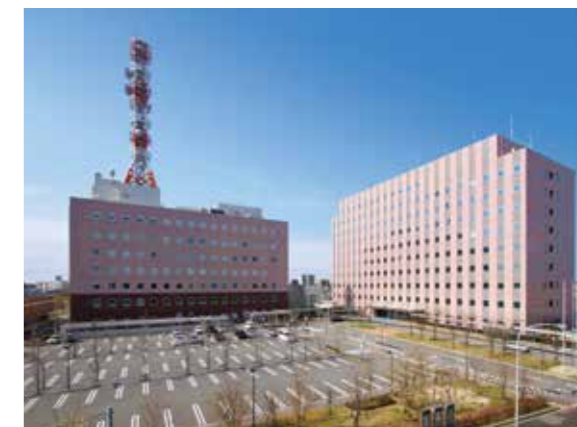
北陸地方整備局(新潟美咲合同庁舎1号館)