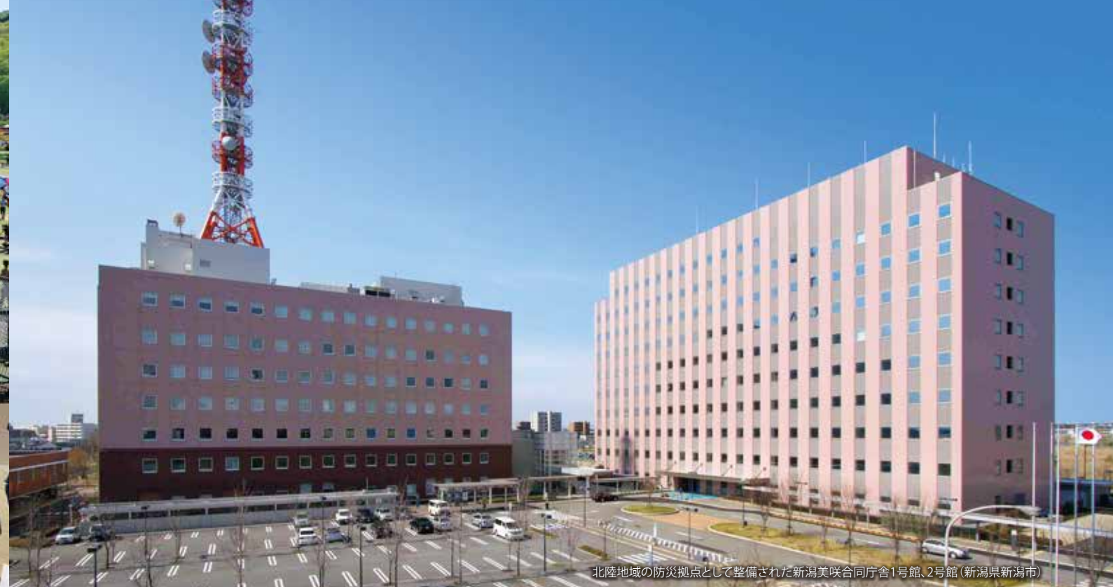
北陸地域の防災拠点として整備された新潟美咲合同庁舎1号館、2号館 (新潟県新潟市)