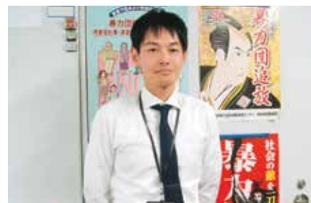
建政部 計画・建設産業課 調査係長

高齢化・人口減少などの社会変化や災害リスクとも向き合いながら、コミュニケーションと遊び心をもって未来のまちを創造する、やりがいのある仕事です。