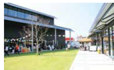
にぎわいの里のいちカミーノ (石川県野々市市)

だれもが快適な生活を送るため、中心市街地の空洞化対策や良好な住宅の供給、バリアフリーなど、様々なまちづくり活動の支援を行っています。また、建設業や宅地建物取引業等の健全な発達のための指導、監督業務を行っています。