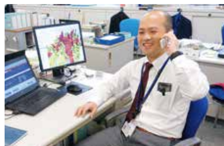
建政部 都市・住宅整備課 企画調査係長