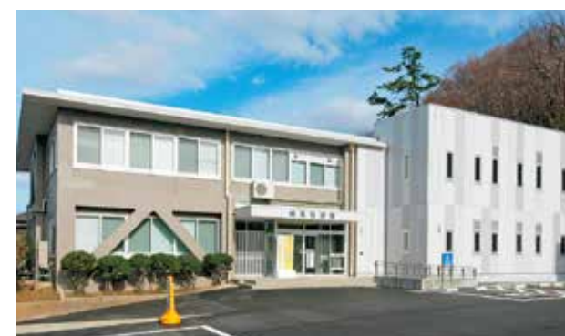
輪島税務署 (石川県輪島市)