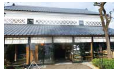
発酵ミュージアム 米蔵 (新潟県長岡市)