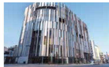
TOYAMAキラリ (富山県富山市)