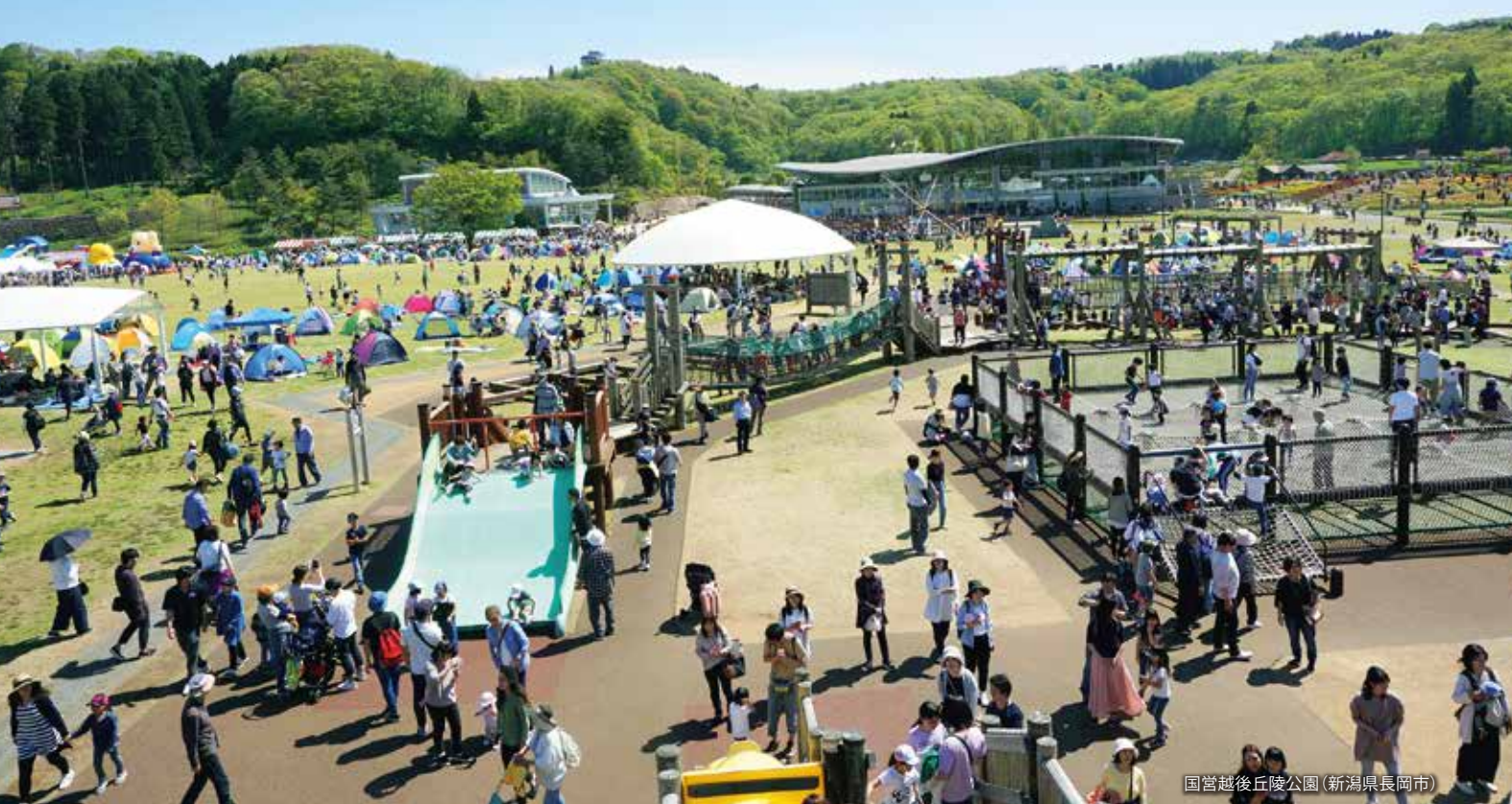
国営越後丘陵公園 (新潟県長岡市)