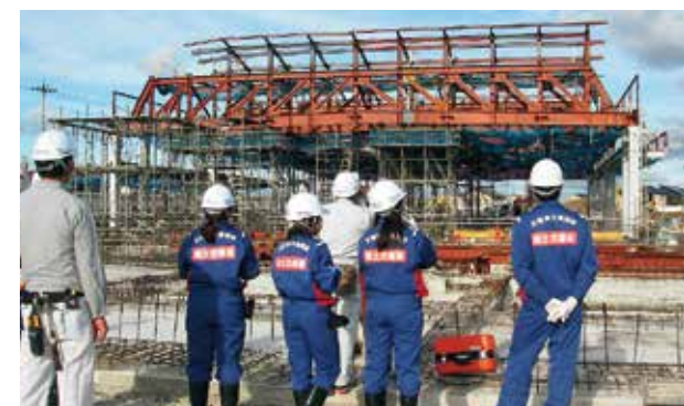
若手職員研修風景

国土交通省では、国の行政機関が入居する「官庁施設」のほか、除雪車両を格納する「除雪ステーション」、道路利用者の休憩と地域振興が一体となった「道の駅」など、多様な公共建築物を整備しています。災害時には、利用者の安全確保だけでなく、地域における災害応急対策活動の拠点施設や避難施設など、防災拠点としての機能も担います。