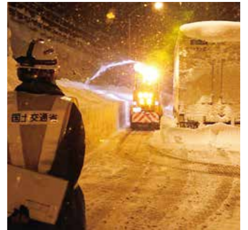
令和2年12月雪害 除雪車による除雪支援(関越自動車道)