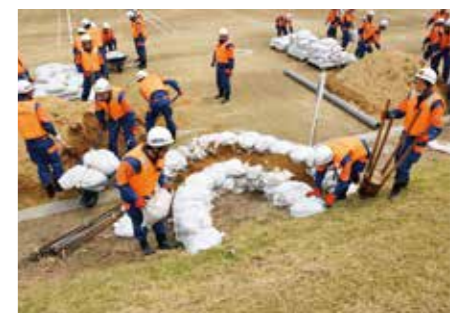
総合水防演習(水防団による水防訓練)