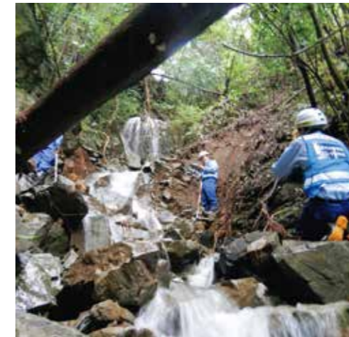
令和2年7月豪雨 砂防の被災状況調査(熊本県山江村)