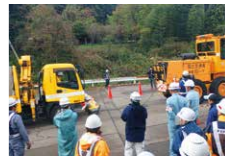
冬の道路交通確保に向けた訓練 (チェーン装着確認や立ち往生車両の移動訓練)