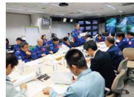
冬の道路交通確保に向けた訓練 (関係機関合同による情報伝達訓練)