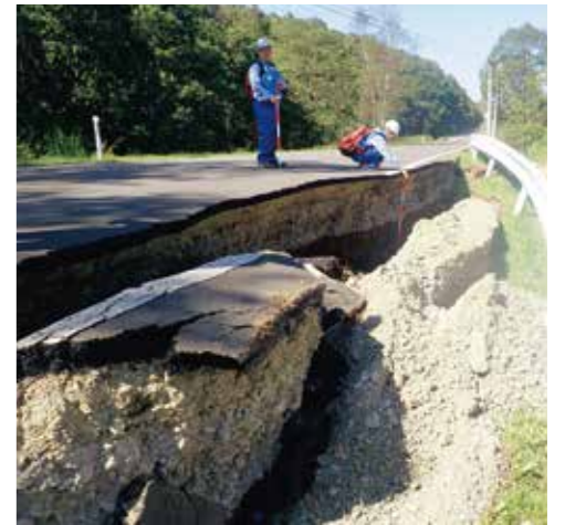
平成30年北海道胆振東部地震 道路の被災状況調査(北海道勇払郡安平町)