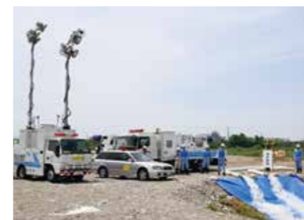
総合水防演習(緊急排水活動訓練)

また、地域の方と一緒に防災について学べるよう、イベントを開催し、地域に密着した防災活動を行っています。