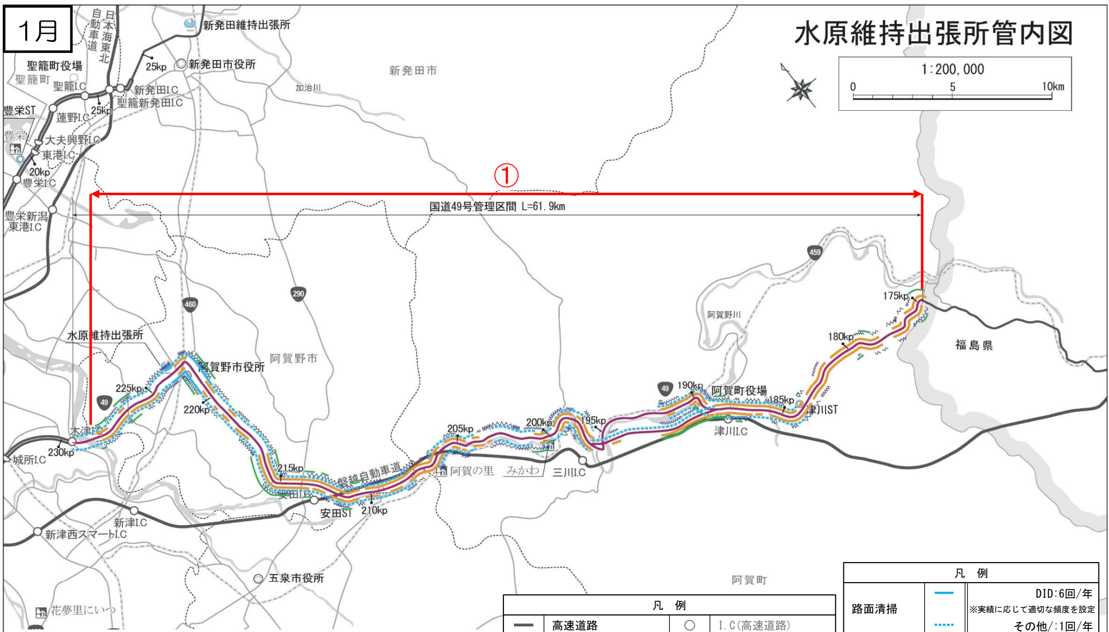
水原維持出張所管内 維持作業予定 令和2年1月予定