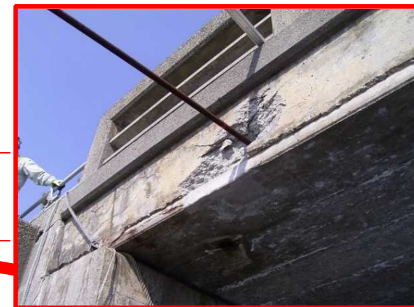
(海側) PC鋼棒 φ23, L=3m突出