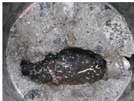
グラウト未充填の状況