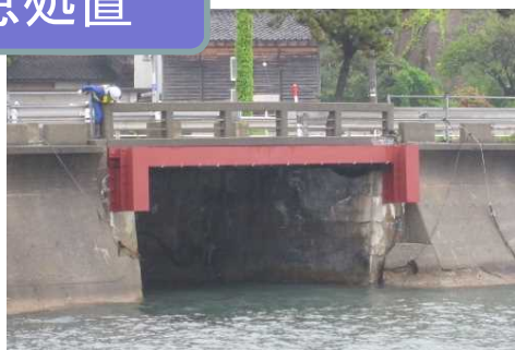
応急処置後の状況