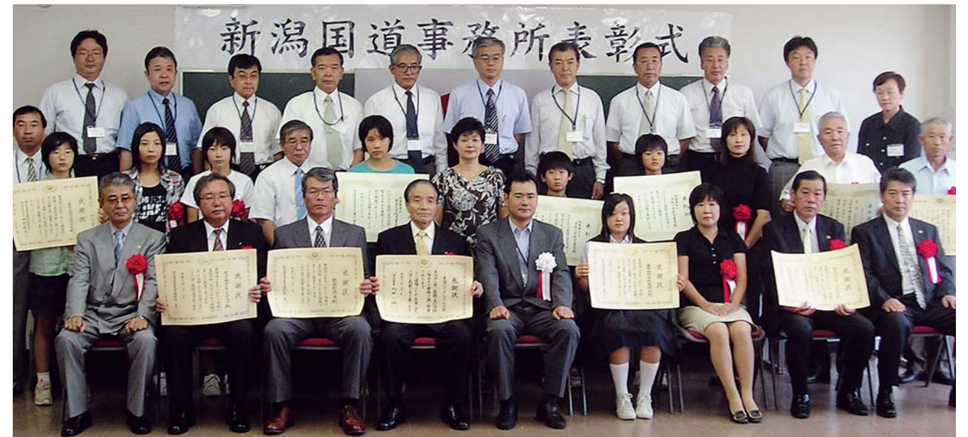
各表彰団体のみなさん

国土交通省では毎年8月を「道路ふれあい月間」として、道路の正しい利用や道路愛護思想の普及に努めています。それに合わせて、新潟国道事務所が開催するのが道路愛護団体等表彰。今回のかかわら版は、8月31日（木）に行われた表彰式の様子をご報告します。また、受賞者の子どもたちのボランティア活動もご紹介します。